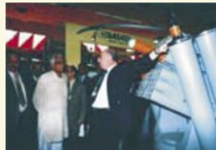
ג'ורג' פרננדס, שר ההגנה של הודו, בביתן הישראלי ב-DEFEXPO INDIA בפברואר 2002 בניו דלהי