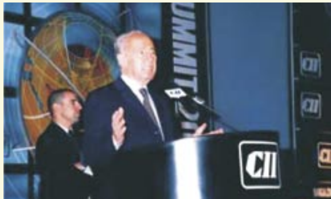
ר"מ לשעבר שמעון פרס ב"פיסגת השותפות" של CII בנגלור ינואר 2002

הקונפדרציה של התעשייה ההודית מקיימת 38 משרדים בהודו, ו-14 נציגויות מחוץ לגבולותיה של הודו: באפגניסטן, אוסטרליה, אוסטרליה, בלגיה, סין, צרפת, ישראל, איטליה, מלזיה, רוסיה, סינגפור, דרום אפריקה, בריטניה הגדולה, ארה"ב, ו-216 שותפויות ממוסדות עם ארגונים מקבילים ב-94 מדינות. בכך הקונפדרציה משמשת מרכז התייחסות של התעשייה ההודית ושל הקהילה