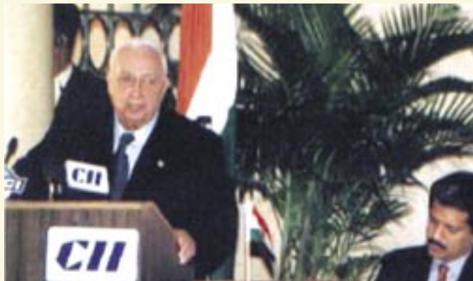
ר"מ אריאל שרון עם נשיא CII אננד מהינדרה בוועידת העסקים ישראל הודו בניו דלהי, ספטמבר 2003

הקונפדרציה של התעשייה ההודית הוקמה כארגון לא ממשלתי ולא למטרת רווח, כדי לבנות ולקיים סביבה המתאימה לגידולם והתרחבותם של מפעלי התעשייה ההודית. מטרה זו מושגת באמצעות הידברות, שיתוף מלא ויעוץ בין התעשייה והממשלה. הקונפדרציה הוקמה לפני 107 שנים וכיום היא ארגון העסקים המוביל של הודו. בקונפדרציה רשומות חברות ישירה מעל ל-48,000 חברות מהמגזר הפרטי והעסקי. 50,000 חברות נוספות, המאוגדות ב-226 התאגדויות לאומיות ואזוריות נוספות רשומות בחברות בלתי ישירה.