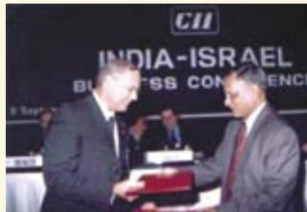
חתימת הסכם בין CII למכון היצוא, ושיתוף פעולה בינ"ל ספטמבר 2003

ירידי הסחר, הכנסים הבינלאומיים והסמינרים שיוזמת הקונפדרציה משמשים פלטפורמות להצגה והפגנת הניסיון, ההתמחות והיכולת לשווק את הודו שכלכלתה גדלה במהירות.